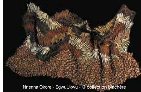
Nhenna Okore - EgwuUkwu - © collection blachère

la journée continue avec le Musée archéologique Lapidaire (collection antique, ancienne chapelle du collège des Jésuites, fleuron de l'architecture baroque) et le Musée Calvet (collection de Beaux-Arts installée dans un magnifique hôtel particulier du 18 e siècle).