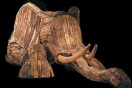
Andries Botha-Wounded Elephant