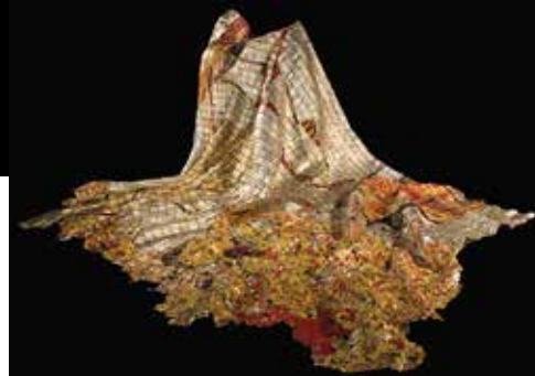
Ei Anatsui - Confluences - © collection blachère

le fil conducteur de l'exposition vous emmènera dans la cour du très beau musée du Petit Palais (ancien palais des Archevêques), au Musée Lapidaire (collection antique, ancienne chapelle du collège des Jésuites, fleuron de l'architecture baroque), au Musée Calvet (installé dans un magnifique hôtel particulier du 18 e siècle).