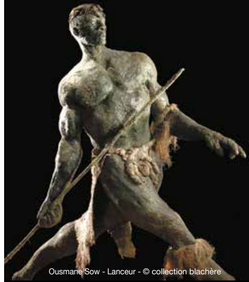
Ousmane Sow - Lanceur